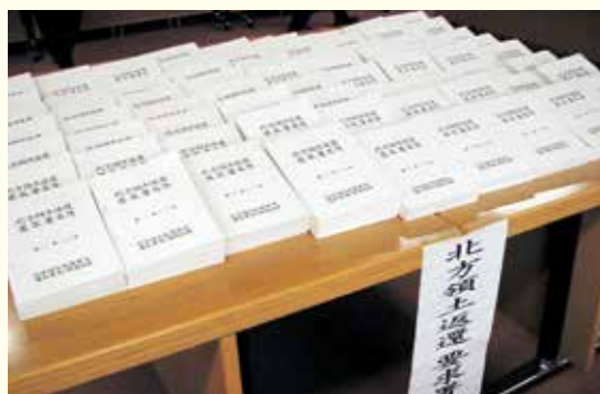
全国から集められた署名簿