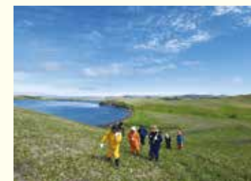
自由訪問での居住地跡の散策(色丹島ボンデバリ)