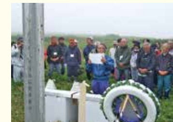
北方領土墓参での慰霊祭

A 元島民を含めた返還要求運動関係者等が北方四島を訪問し、各島に在住するロシア人と交流することによって、相互理解と友好を深めています。住民交流会やホームビジット等の行事があります。