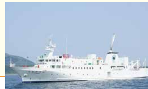
四島交流等事業使用船舶「えとびりか」

A 会員などが北方四島へ訪問する枠組みは、自由訪問・北方領土墓参・北方四島交流があります。