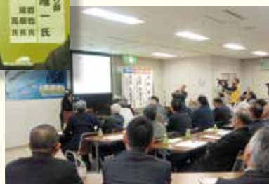
後継者による語り部