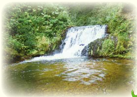
国後島 ウエンコタン川第二滝