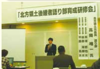
後継者による語り部の実践練習

元島民の高齢化により、当時の島の様子を知る方々が減少しているため、元島民の北方領土返還に対する熱い思いを語り継ぐ後継者を育成しています。