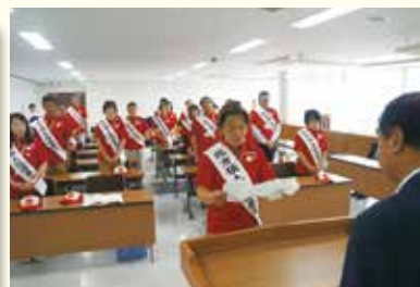
盛岡市への表敬訪問

後継者活動の充実を図るため後継者が中心となったキャラバン隊を編成し、各地で街頭啓発や自治体首長等へのアピールを行っています。