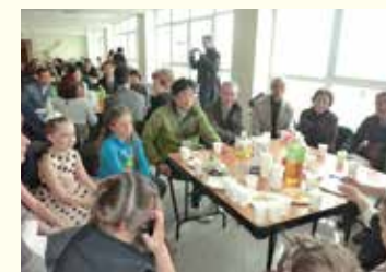
北方四島交流での住民交流会