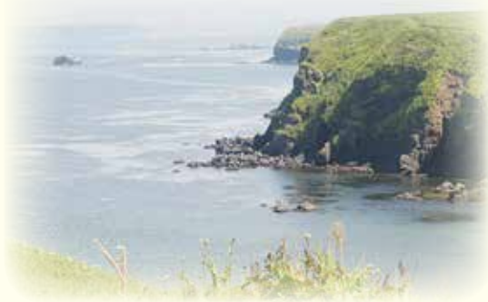
歯舞群島秋勇留島 オタモイ海岸