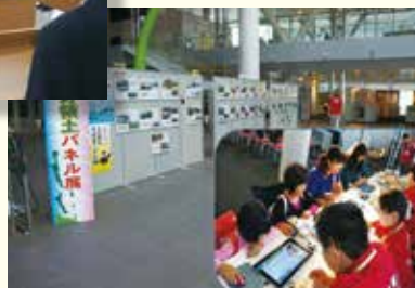
パネル展啓発活動