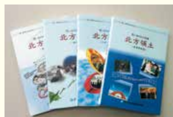
千島連盟発行の図書 「～若い世代に伝えたい～ 思い出のわが故郷北方領土」

A 千島連盟や各団体等で作成した図書や資料等がありますので、お問い合わせください。