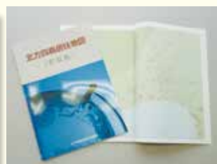
北方四島居住地図 (択捉島、国後島、 歯舞群島・色丹島)