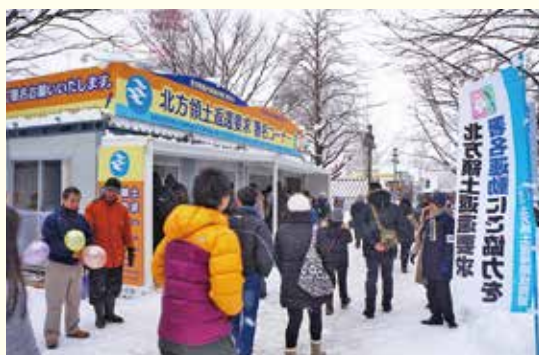
「さっぽろ雪まつり」会場での署名運動

A 全国から千島連盟に集められた署名をもって、毎年国会に対する請願が行われています。