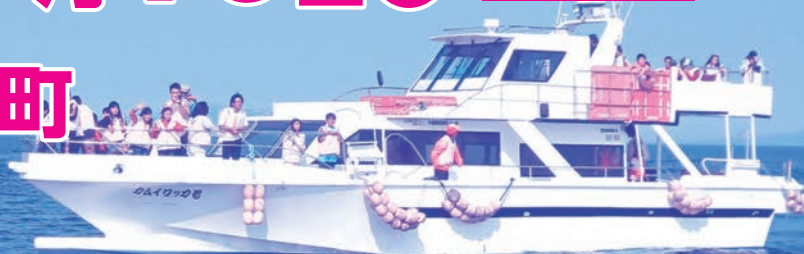
写真:国後島がこんなに近いと感じる中間距離地点