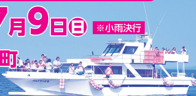
写真:国後島がこんなに近いと感じる中間距離地点

9:30 集合・受付(ホテル 峰の湯) 時間厳守 10:00 北方領土問題学習会 北方領土のお話・高校生の出前講座・北方領土クイズ 11:50 昼食 12:30 羅臼港へ移動 12:45 記念写真撮影 13:00 乗船・国後島を洋上見学 15:30 帰港・解散