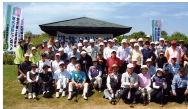
参加者で集合写真