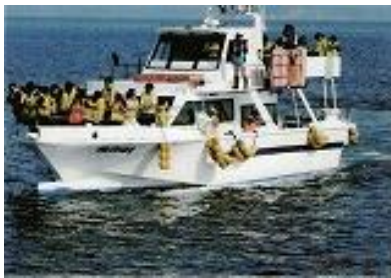
ゴジラ岩号に乗船