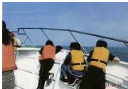
洋上から国後島を視察