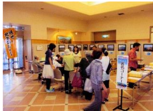
賑う北方領土クイズコーナー