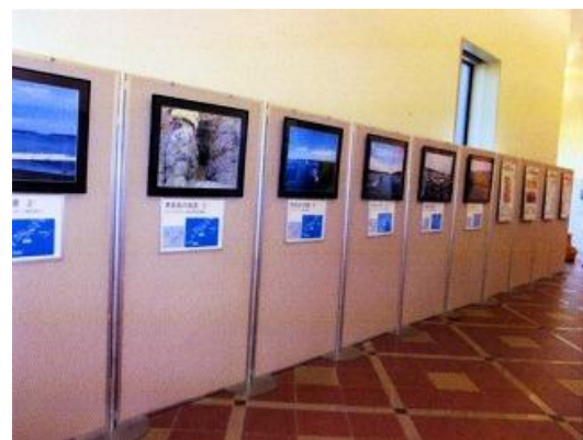
北方領土パネル展