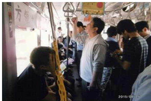
車内では、掲示物での啓発やリーフレットの配布、署名活動を行った