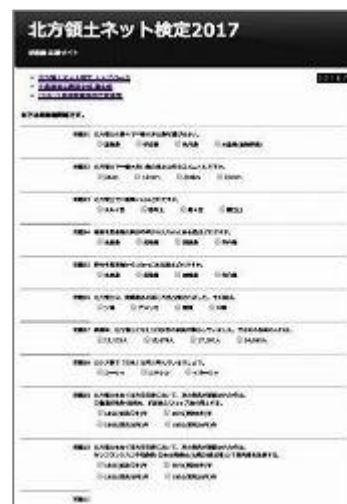
北方領土ネット検定 応募サイトのページ