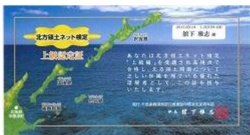
合格者全員に送付した認定書