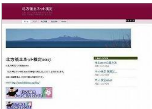
北方領土ネット検定サイト http://kentei.chishima.org/