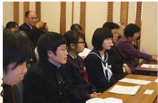
真剣に話を聞く中学生たち